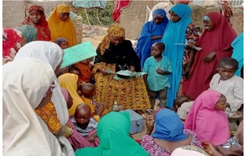
Les personnes n'ayant reçu aucune dose ou n'ayant pas été vaccinées sont suivies et vaccinées lors de la cérémonie d'attribution du nom, village de Bargi