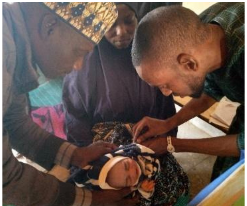
Un chef de famille présentant un nouveau-né pour la vaccination, brisant la barrière de genre et soutenant l'égalité en matière d'immunisation